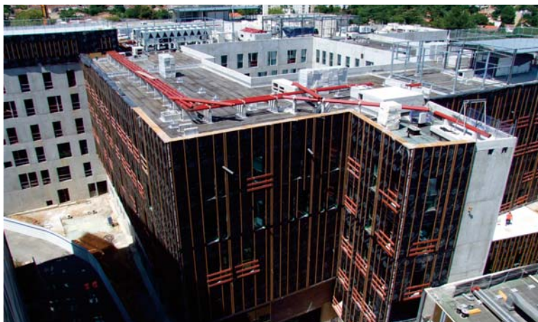
Le chantier vu du point culminant de R. BOULIN au 12 Août 2016