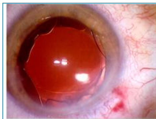
8 Implant en place dans le sac