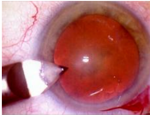
2 Incision de l'ouverture de service