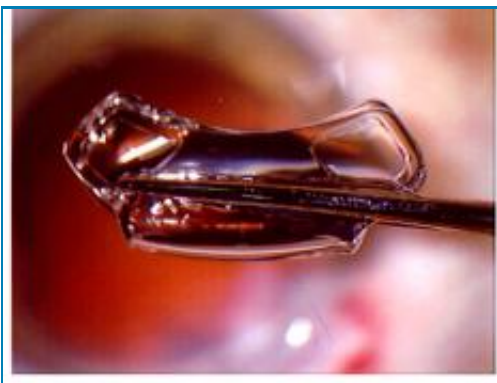
7 Pliage de l'implant souple