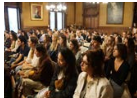
Accueil des internes à la Mairie de Libourne