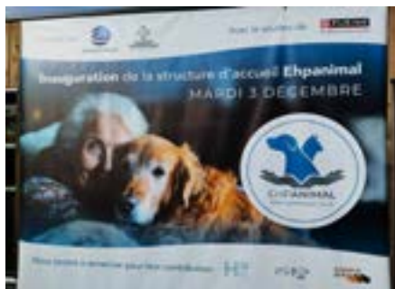
Inauguration de l'ephanimal

Un projet ambitieux porté par la Région Nouvelle-Aquitaine, l'Union Européenne (FEDER), l'Agence Régionale de Santé de Nouvelle-Aquitaine et le Centre Hospitalier de Sainte-Foy-La-Grande pour améliorer l'accès à la formation sanitaire sur le territoire.