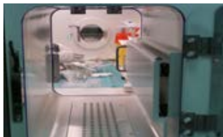
Le sac de stérilisation

Ce dispositif réalise une analyse rapide à partir d'un échantillon de la poche, en mesurant à la fois la concentration et l'identité des molécules et du solvant de dilution.