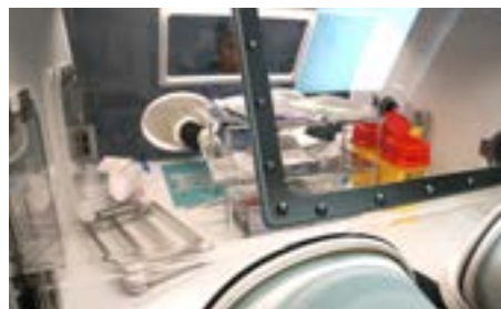
Préparation sur mesure des traitements chimiothérapeutiques

Ce projet représente une avancée majeure pour l'hôpital, garantissant des soins plus sûrs et une gestion optimisée des traitements de chimiothérapie.