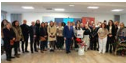
Inauguration des locaux de l'IFAS avec les étudiants

Ce nouvel Institut de Formation Aide Soignant crée une véritable proximité entre les lieux de vie des élèves et leurs futurs environnements professionnels, tout en soutenant une politique de santé durable en phase avec les priorités régionales.