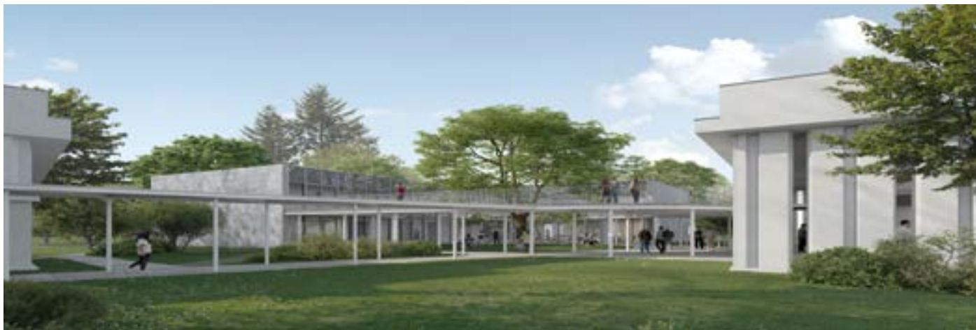
Vue du bâtiment neuf et de son espace partagé (réalisée par les agences POGGYArchitecture et A3Architecture)

Dans le cadre d'une volonté nationale d'augmenter les capacités de formation dans le domaine de la santé, le Centre Hospitalier de Libourne se lance dans un projet ambitieux : la création d'un campus des métiers de la santé sur le site de Garderose.