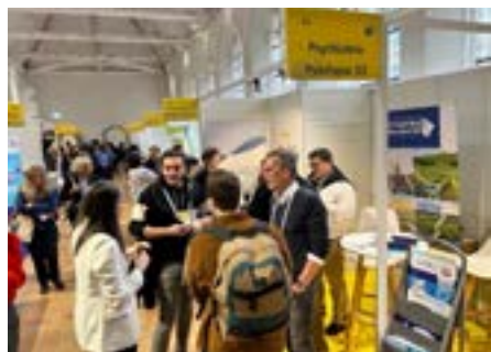
Congrès de psychiatrie à Rennes