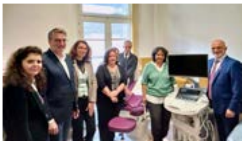
Inauguration du CPPM

Le Centre Hospitalier de Sainte-Foy-la-Grande élargit son offre de soins en périnatalité avec l'ouverture d'un Centre Périnatal de Proximité (CPP) et des 1 000 Premiers Jours.