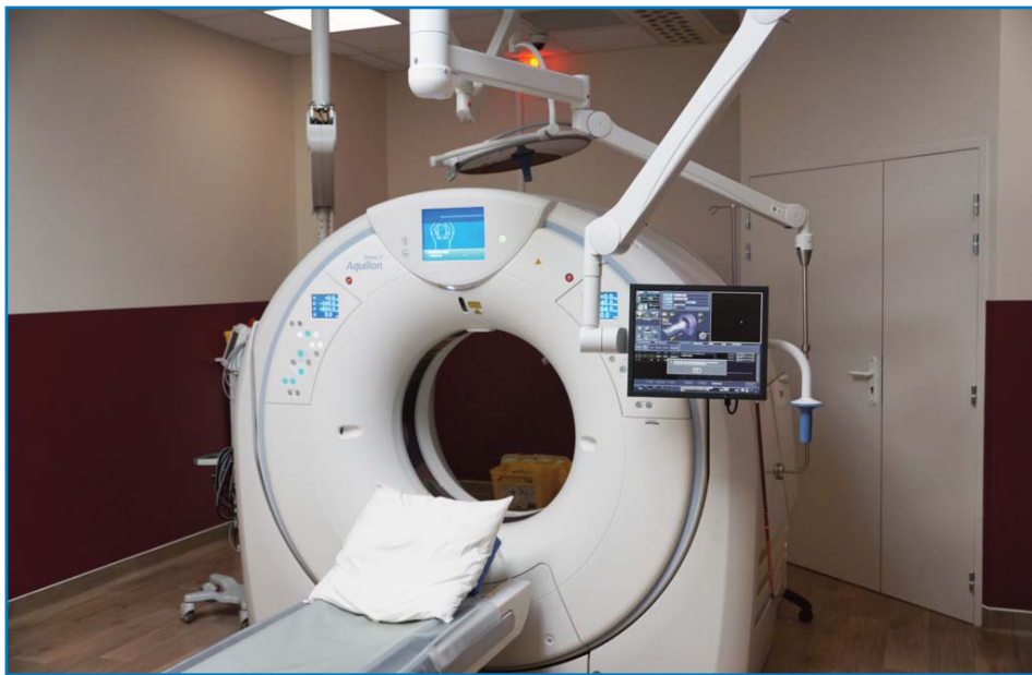
Le nouveau scanner CANON acquis par le centre hospitalier de Libourne. Il permettra notamment de développer l'activité d'imagerie interventionnelle et d'améliorer les performances d'acquisition et d'aide au diagnostic

Le second scanner du service d'imagerie médicale a été remplacé début avril 2018. Cette nouvelle machine, performante et toujours moins irradiante, va notamment permettre le développement de l'activité d'imagerie interventionnelle.