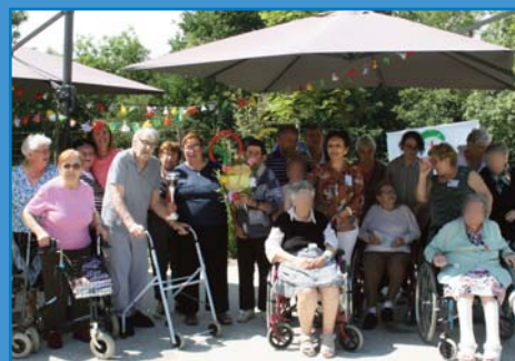
Et l'équipe médaille d'or, l'équipe de St Denis de Pile