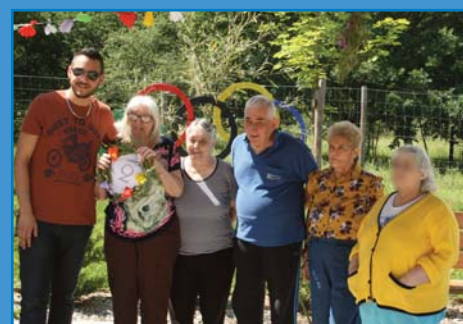
équipe de la Belle Isle, médaille d'argent