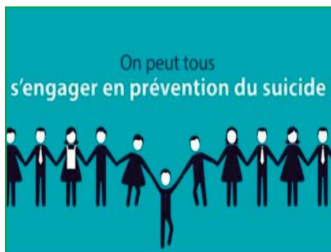
La prévention du suicide chez les jeunes fait partie des axes inscrits dans la stratégie nationale de santé 2018-2022

La création d'un poste d'animateur en santé publique est un réel atout pour le suivi et la coordination du programme «hors les murs». la communication de leur existence auprès des professionnels médico-sociaux ou sociaux «de terrain» sera également un enjeu majeur pour la réussite de ces actions.