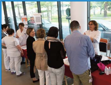
Le stand animé par l'EOH lors de la journée du 17 mai à destination des professionnels mais également des usagers

Le 17 Mai, l'Equipe Opérationnelle d'Hygiène (EOH) est allée à la rencontre des patients et des professionnels pour promouvoir l'hygiène des mains et le « zéro-bijou » dans le cadre de la journée mondiale d'hygiène des mains.