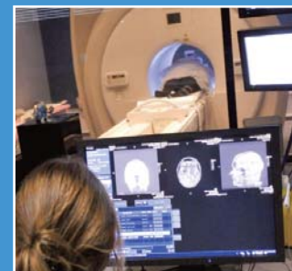
L'IRM actuellement en service

Outre l'amélioration du délai moyen de prise en charge, l'étoffement du plateau technique libournaise permettra de surcroît le développement de nouvelles activités comme la Cardio-IRM ou l'IRM pédiatrique et néonatalogique, avec le soutien des équipes du CHU de Bordeaux et à la création de postes d'assistants à temps partagés spécialisés.