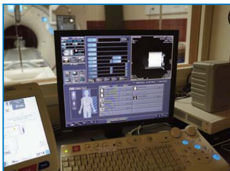
Le «poste de contrôle» du nouveau scanner

Enfin, cette machine a été acquise avec un objectif de développement d'activité précis. En effet les demandes d'imagerie interventionnelle ont fortement augmenté et le choix de cette machine en tient compte, jusque dans les travaux d'aménagement de la salle qui l'abrite : positionnement de la machine, fixation des instruments nécessaires à l'activité... l'ergonomie de la salle a été pensée pour permettre de « travailler » autour du patient. Mobilité, hygiène et performance ont donc été les maître-mots lors de la préparation de l'arrivée du nouveau scanner.