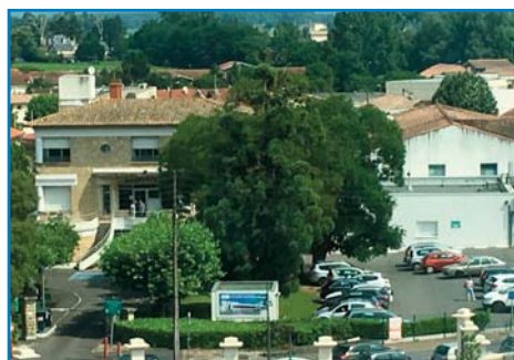
La Clinique, voisine directe de Robert BOULIN

La nouvelle structure prendra la forme d'un GCS établissement de santé de droit privé, permettant ainsi aux acteurs médicaux, soignants et administratifs de la clinique de poursuivre leur exercice dans un cadre identique à celui qu'ils connaissent aujourd'hui. En revanche, l'actionnaire principal en sera le centre hospitalier de Libourne.