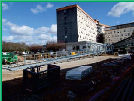
Les travaux d'installation de la passerelle, entrée « provisoire » du monobloc en mutation