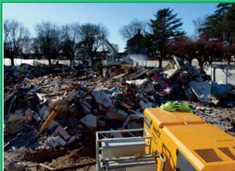
La crèche et l'autocommutateur, les deux derniers bâtiments détruits