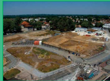
Le chantier, prêt, à la veille du premier « coup de pioche »

... Le choix du groupement réalisé, les opérations préalables au chantier se sont poursuivies début 2015.