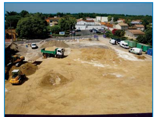
Jun 2017 - Dernières finitions extérieures et aménagement des abords, comme ici le parking P1, future «vitrine» de l'établissement désormais ouvert sur la Rue de la Marne