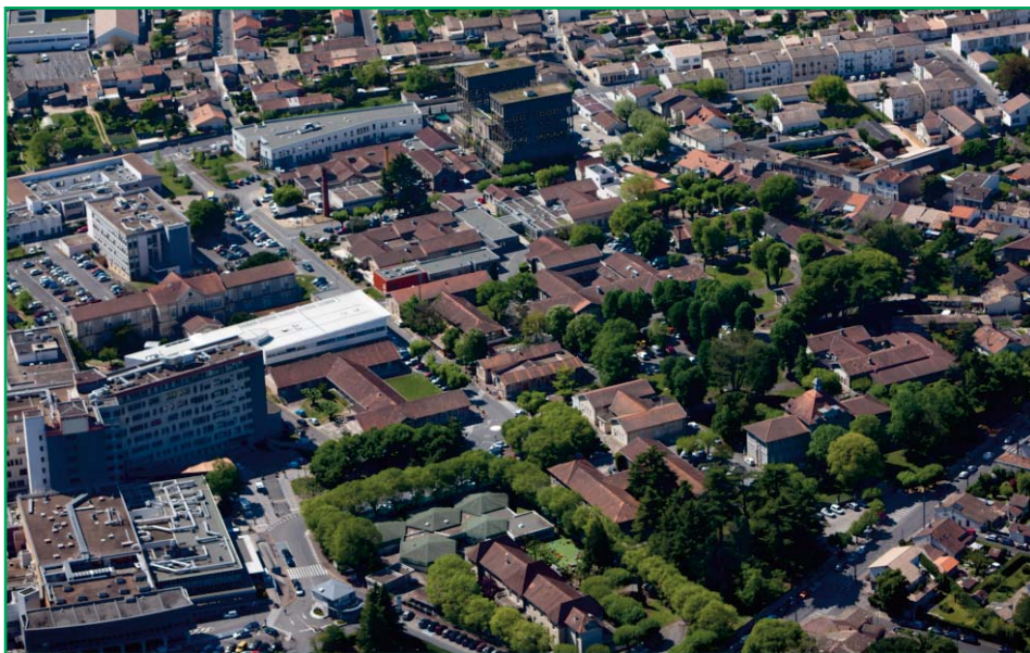
Le site en Avril 2014 - l'EHPAD Belle-Isle vient d'entrer en service. Les bâtiments 2, 3 et 23 sont vides et les préparatifs pour la déconstruction sont lancés.

Conformément aux règles de la procédure de conception-réalisation, des discussions sont engagées avec ce groupement afin de réaliser un travail de mise au point technique.