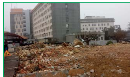
La pavillon 22, connu aussi pour son club médical et sa salle Diard, libère la partie qui sera pendant presque 3 ans la nouvelle entrée du monobloc