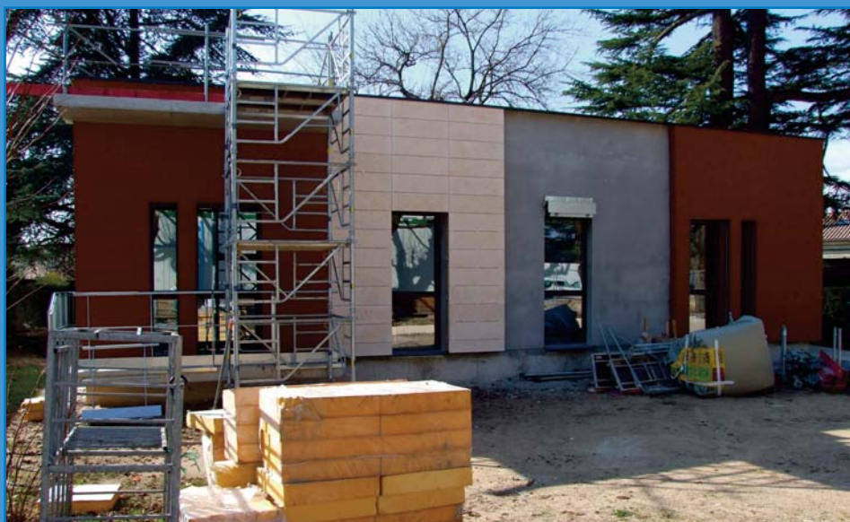
Le pavillon témoin a aussi été l'occasion pour le constructeur d'exercer ses équipes à la pose des matériaux choisis par l'architecte pour les façades

La construction d'un bâtiment témoin ; plus qu'un showroom, un véritable outil de validation des choix architecturaux et mobiliers.