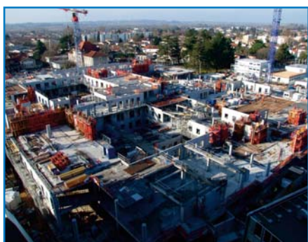
Décembre 2015 - Sectorisé par grue, le chantier avance vite dans sa phase «gross oeuvre» ; 2 niveaux sont déjà achevés .