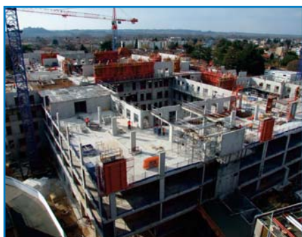
Mars 2016 - le niveau 4 est en cours d'achèvement, les galeries de liaison avec le monobloc apparaissent