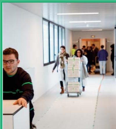
Les liaisons avec l'ancien monobloc ont permis d'assurer une bonne partie des transferts de services

Dès l'ouverture de la nouvelle entrée de l'hôpital Robert BOULIN, les usagers se sont appropriés ce nouvel espace. Bien sûr la transition entre les deux bâtiments et la phase intermédiaire a été complexe, mais la bonne volonté de tous les hospitaliers a joué son rôle.