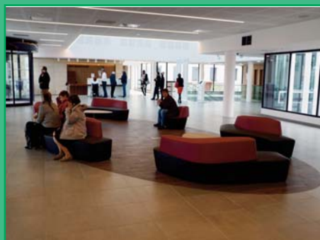
Les usagers ont pris possession de l'atrium et du hall du nouvel hôpital

Dès l'ouverture de la nouvelle entrée de l'hôpital Robert BOULIN, les usagers se sont appropriés ce nouvel espace. Bien sûr la transition entre les deux bâtiments et la phase intermédiaire a été complexe, mais la bonne volonté de tous les hospitaliers a joué son rôle.