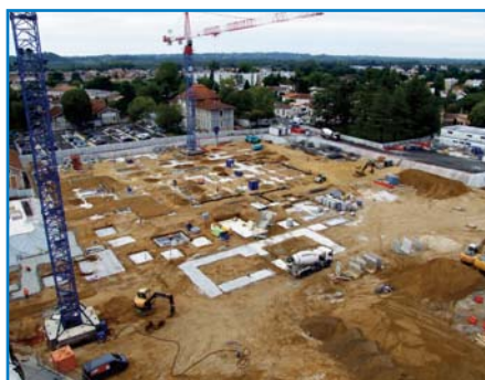
Jun 2015 - le chantier démarre : les grues sont en place et les premières fondations sont coulées