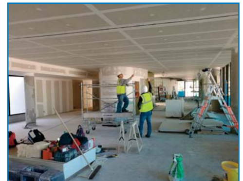
Mars 2017 - l'atrium fait partie des derniers espaces aménagés ; il a constitué pendant ces derniers mois le point d'accès pour tous les matériaux

Les hospitaliers libournais sont alors mobilisés dès le mois d'avril pour débuter les OPR, Opérations Préalables à la Réception. Chaque pièce, chaque circulation doit être inspectée et contrôlée afin de vérifier qu'elle correspond bien au cahier des charges et que son achèvement est parfait. c'est un travail fastidieux de reporting suivi en parallèle par GTM et les équipes de Direction des Fonctions Techniques et Travaux qui est conduit. Objectif : réceptionner le bâtiment fin septembre - début octobre comme prévu initialement.