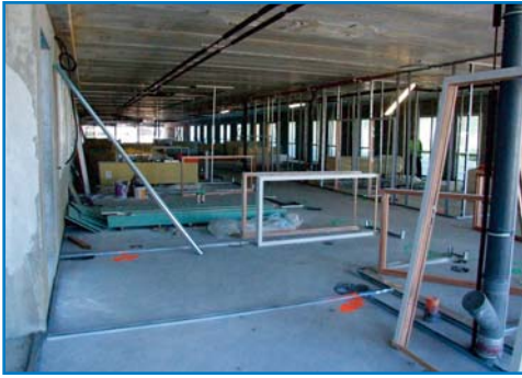
Jun 2016 - Parallèlement à la fin du gros oeuvre, les travaux de cloisonnement débutent