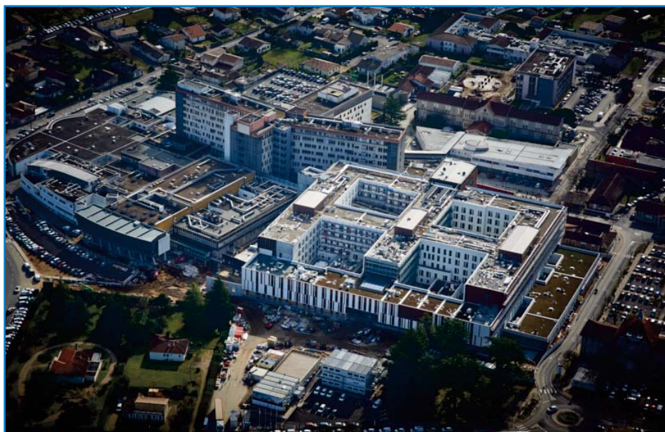
Le chantier au mois de février 2017, vu depuis le ciel ; l'enveloppe extérieure est achevée.

Durant 27 mois, les équipes de GTM Bâtiment Aquitaine ont travaillé main dans la main avec le centre hospitalier et l'ensemble des entreprises partenaires du projet.