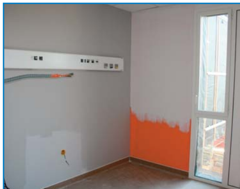
Janvier 2017 - pose des bandeaux tête de lit dans les chambres et premiers essais de couleur

Il a également souhaité échanger avec les médecins et cadres de santé impliqués dans le projet NHL ... un événement pour l'établissement et un excellent souvenir pour les acteurs du projet.