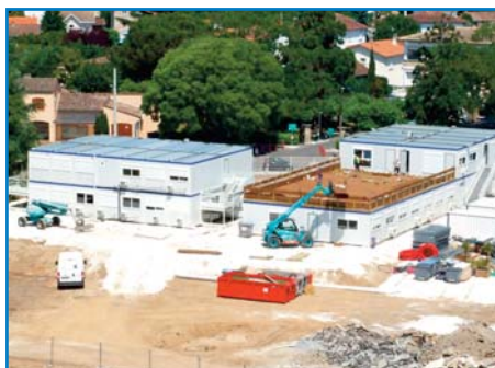
La base-vie du chantier en juin 2015

Arcadis - ARCHITECTURE COULEUR - BEST - Chabanne et partenaires - GTM Bâtiment Aquitaine (mandataire) - Hervé Thermique - IDB ACOUSTIQUES - Ineo - Niveau 3 - P4X - SICC - STRUCTURE ILE DE France - STRUCTURE GEOTECHNICS