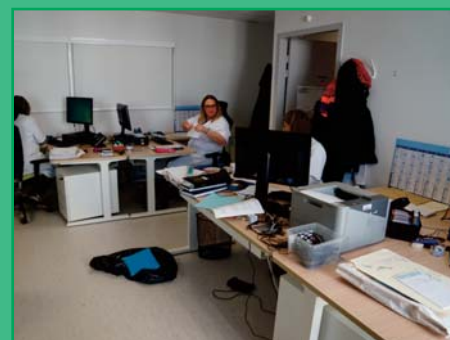
Les secrétariats s'installent pour être rapidement opérationnels