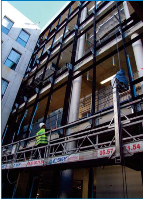
Aout 2016 - Pose des murs rideaux couvrant les galeries de circulation «usagers». Avec les patios, elles permettent d'apporter une luminosité sans commune mesure avec celle du monobloc.