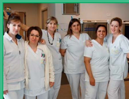
Les équipes découvrent le bâtiment «en fonctionnement réel»

Debuté le 5 mars, le transfert des activités s'est étalé en quasi-totalité sur les 3 semaines suivantes. La médecine gériatrique a ouvert cette période qui s'est achevée avec le transfert de la gynécologie-obstétrique.