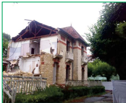
Démolition du pavillon 23

Parallèlement à cette démarche, l'établissement a débuté plusieurs opérations préalables visant à libérer l'emprise foncière nécessaire à une reconstruction :