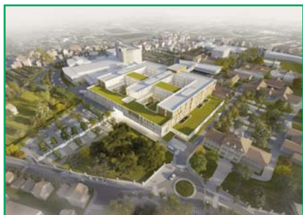
Le projet présenté par le groupement GTM-Chabanne

En effet, la Directrice générale de l'époque choisit de demander l'intervention de l'Inspection Générale des Affaires Sociales (IGAS) pour statuer sur la pertinence ou non d'une reconstruction ; la conclusion des inspecteurs de l'IGAS est sans appel : au regard de son dynamisme et de son activité, la reconstruction est nécessaire MAIS elle peut être adaptée pour être plus économique. C'est cette orientation que prendra alors le projet NHL, une reconstruction partielle sur site, avec la conservation du plateau technique existant qui a fait l'objet d'investissements récents.