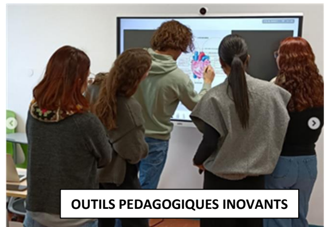
OUTILS PEDAGOGIQUES INOVANTS