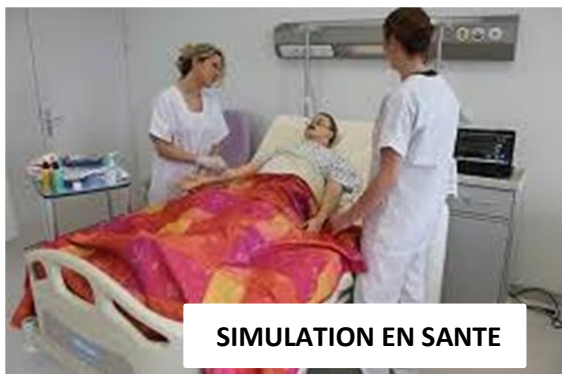
SIMULATION EN SANTE