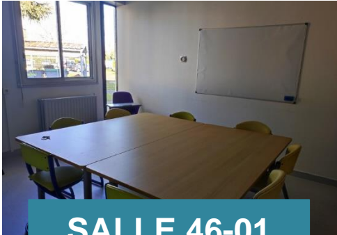
SALLE 46-01 VIVALDI