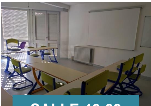
SALLE 46-03 LULLY